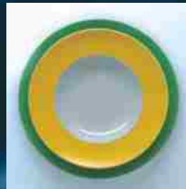
Serie farbig Classic

Zu einer Zeitreise durch ein Jahrhundert der Porzellanherstellung lädt Sie unser Porzellanmuseum auf mehr als 200 m 2 Ausstellungsfläche ein.