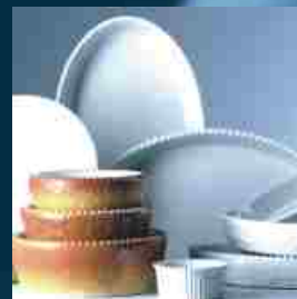
feuerfestes Back- u. Kochgeschirr