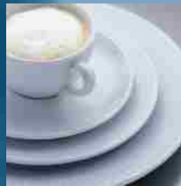
Serie white graphics