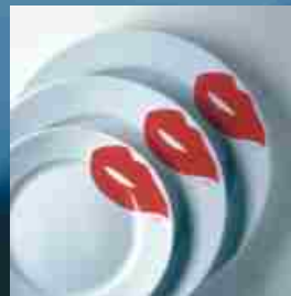
Serie Kisses by rosalie