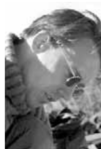
Design: Thomas Kalz